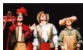
EL VIAJE DE CLAVILEÑO DON QUIJOTE