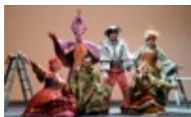
6 PERSONAJES PARA 6 PAYASOS CLOWNS