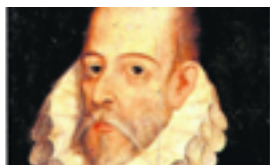
MIGUEL DE CERVANTES 1546-1616

MEDALLA DE ORO AL MÉRITO EN LAS BELLAS ARTES 2010